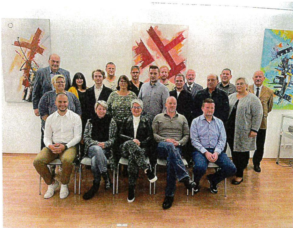
Gemeinderat der Gemeinde Sigleß